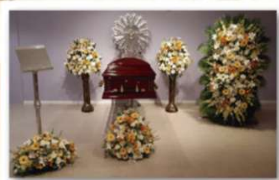
FLORES ECOLÓGICAS (ALUGUEL)