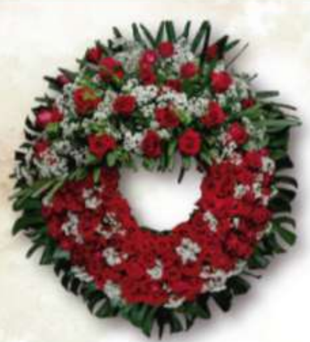
FLORES NATURAIS (COMPRA)

As mais belas homenagens traduzidas em flores e decorações para capelas